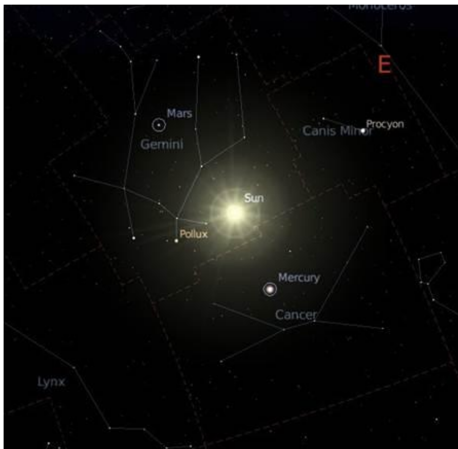
Fig. 1: Configuração celeste na hora do meu nascimento (17/07/1983).

Segundo o programa, meu signo solar deveria ser Gêmeos, como mostra a Figura 1, ao contrário do que sempre me pregaram os astrólogos. Por puro desencargo de consciência, chequei sobre qual constelação a Lua permanecia, também no momento de meu nascimento e, para minha surpresa novamente, estava na constelação de Virgem; os astrólogos haviam me categorizado como libriano no signo lunar. Fui tirar a prova com um programa menos 3D e mais