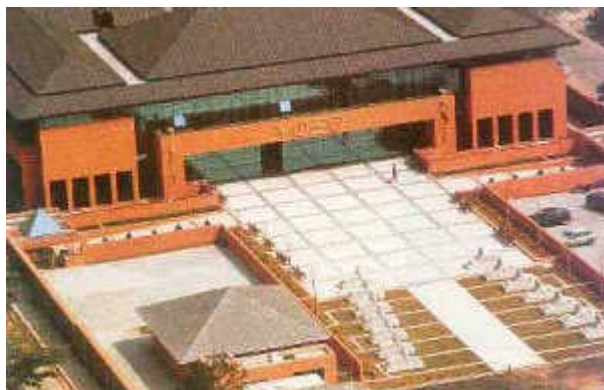
Visão aérea da nova sede do Pró-Vida

“Se você já estiver preparado, uma força maior o levará ao Pró-Vida”